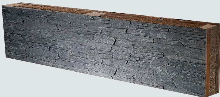
HORIZONTALNI PRESJEK ZIDA