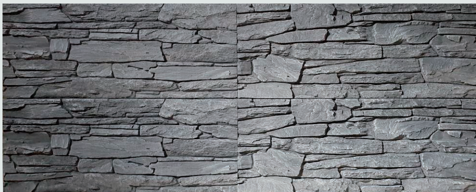
IZGLED FASADNOG ZIDA